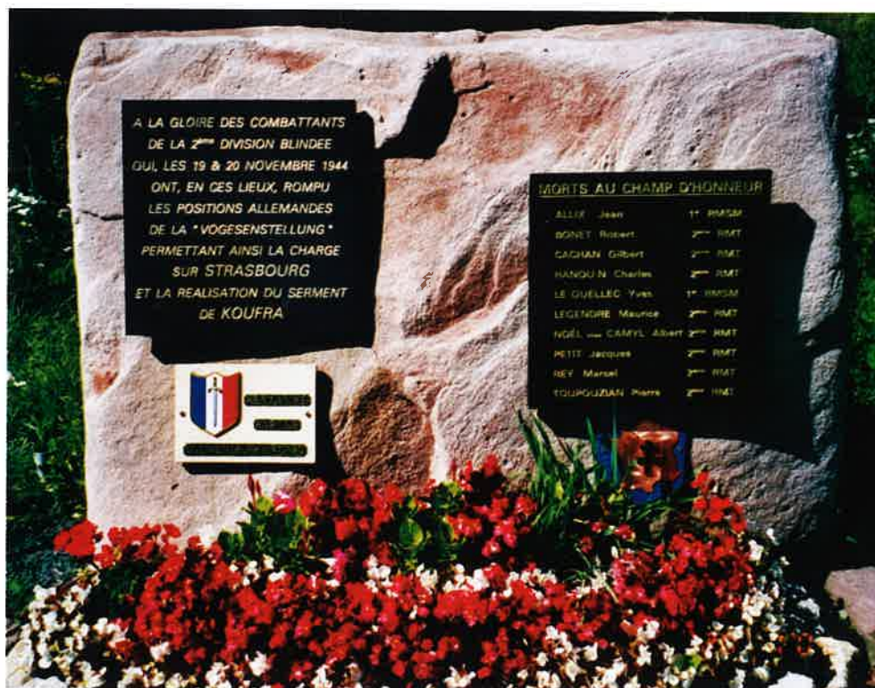
Mémorial aux soldats du 2 ème Bataillon du RMT 1 et du 1 er Régiment de Marche de Spahis Marocains morts autour de Lafrimbolle.

Les dents de dragons étaient en fait composées de grumes plantées dans le sol, alternativement à la verticale et à 45°. Cette rangée de dents de dragons se trouvait à peu près au milieu de la vallée. Au niveau de la route menant à Saint Quirin, une série d'« arcs de triomphes » ont été constitués avec des troncs d'arbres. Cela permettait l'usage de la route aux troupes allemandes. Des explosifs fixés sur les troncs de soutien firent écrouler les « arcs de triomphe » et bloquèrent la route en quelques secondes. Le dispositif était complété d'un fossé antichar et de canons antichars dissimulés dans les sous-bois. Le pont de la Sarre Blanche vers Niderhoff a été détruit par les Allemands pour obliger le passage des véhicules ennemis par la vallée.